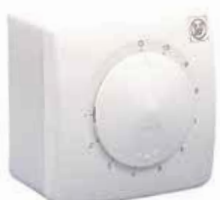
REB 1 N; REB 2,5 N