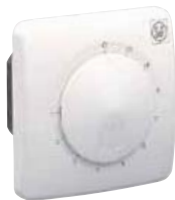
REB 1 NE; REB 2,5 NE