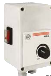
REB 5; REB 10